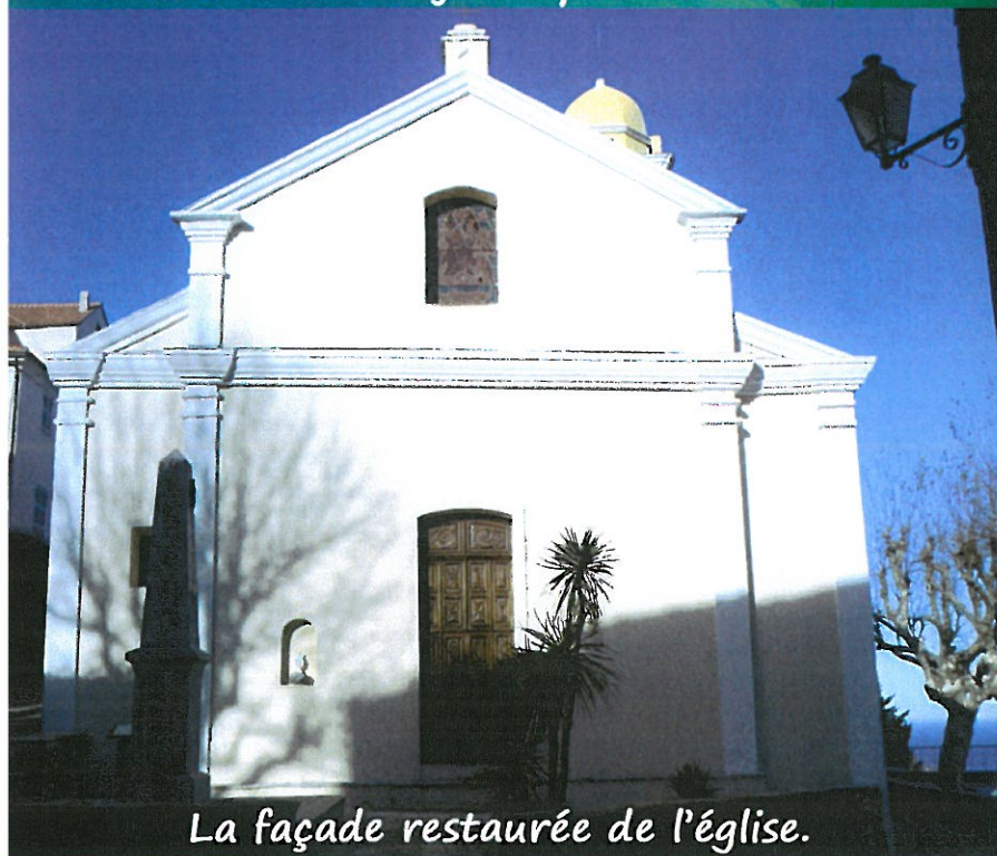
La façade restaurée de l'église.

A facciata di a chjesa : più bella chè mai!!!